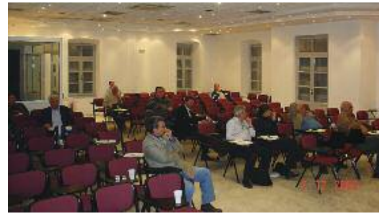
Άποψη της αίθουσας