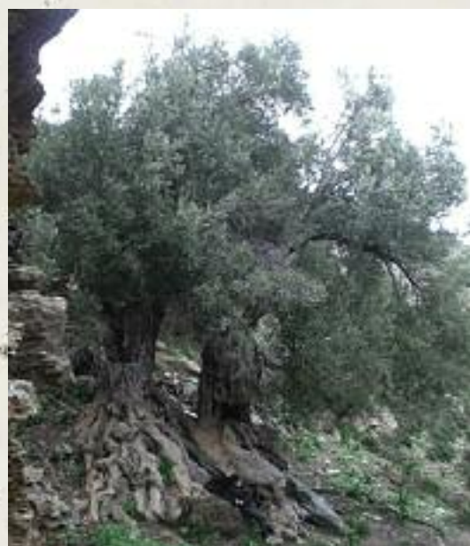
Ελιά στο Μπαλί

Συγκεκριμένα, ο Μίκης Θεοδωράκης είπε ότι στηρίζει με όλες τις δυνάμεις του την πρωτοβουλία αυτή.