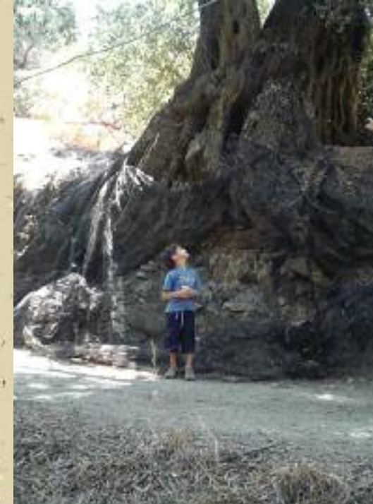
Δεξιά: Ελιά στην Κάντανο