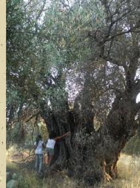
Δεξιά: Ελιά στην Πλώρα