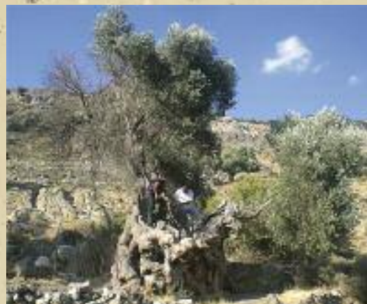
Ελιά στα Βορίζα