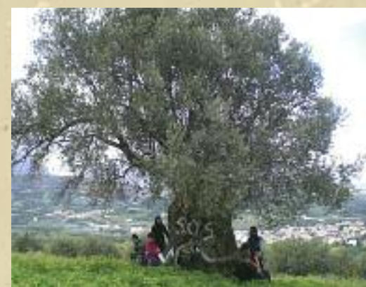
Ελιά στο Βενεράτο