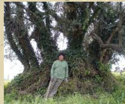
Η Ελιά και ο παπούς