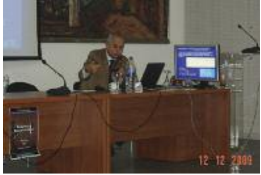
ποδομής σε όλα τα ευρωπαϊκά κράτη-μέλη.

Το Τμήμα μας πριν από μερικούς μήνες διοργάνωσε σε συνεργασία με το Σύλλογο Πολιτικών Μηχανικών Ελλάδος Διημερίδα με θέματα αντισεισμικού και γεωτεχνικού σχεδιασμού των κατασκευών. Ιδιαίτερη αναφορά έγινε σε θέματα επισκευών και ενισχύσεων υφισταμένων κτιρίων από οπλισμένο σκυρόδεμα και τοιχοποιία και δόθηκε έμφαση στον εμπεριλαμβανόμενο ΚΑΝΕΠΕ (ΚΑΝονισμό ΕΠεμβάσεων-Ενισχύσεων) και τους Ευρωκώδικες, όπως επίσης και στις νέες μεθόδους ανάλυσης και ελέγχου των υφισταμένων κατασκευών.