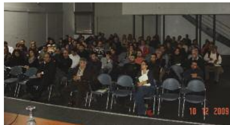
Άποψη της αίθουσας την 10/12/09

είτε κατασκευάζουν οι ίδιοι έργα, απαιτείται όχι μόνο να είναι ενημερωμένοι για τις πιο πρόσφατες εξελίξεις στην αντισεισμική τεχνολογία, αλλά και να φροντίζουν ώστε αυτές να υλοποιούνται στην πράξη, δηλαδή στις κατασκευές, στις οποίες επιβάλλεται