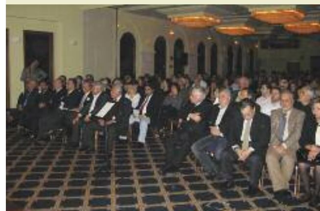
Άποψη από την κατάμεστη με κόσμο αίθουσα