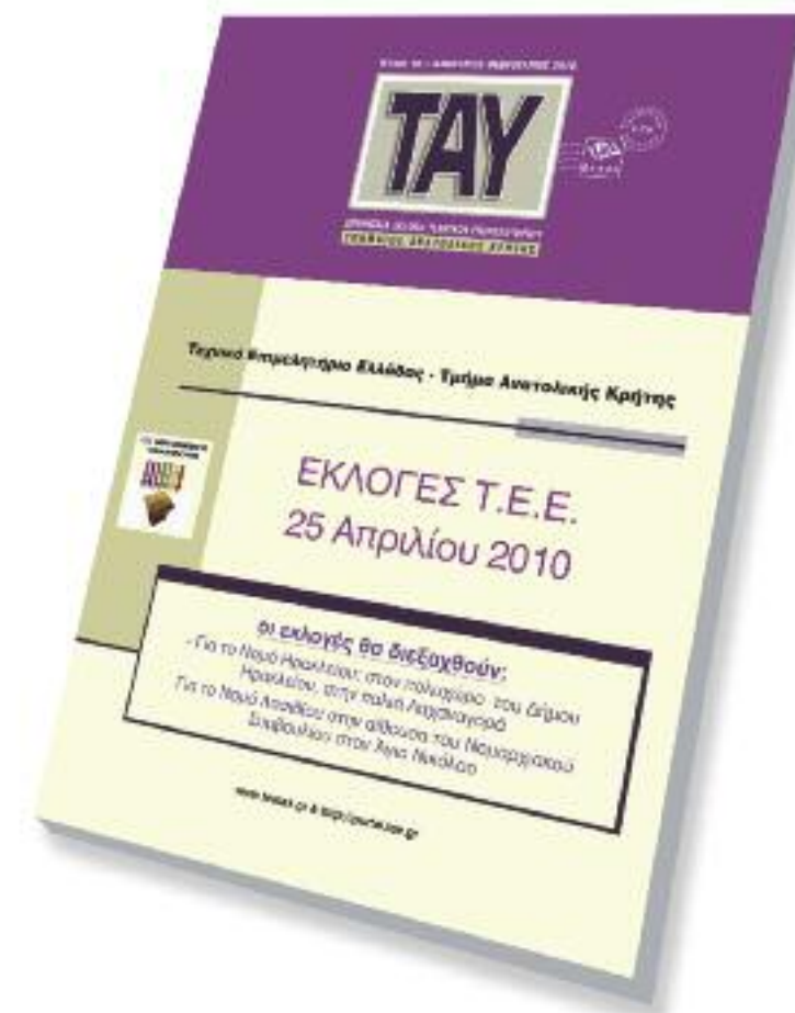
Φωτογραφία εξωφύλλου: ΕΚΛΟΓΕΣ ΣΤΟ ΤΕΕ: ΚΥΡΙΑΚΗ 25 ΑΠΡΙΛΙΟΥ 2010