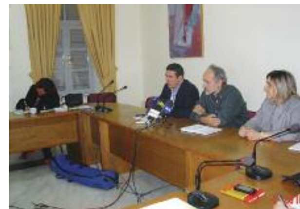
Από τη συνέντευξη τύπου