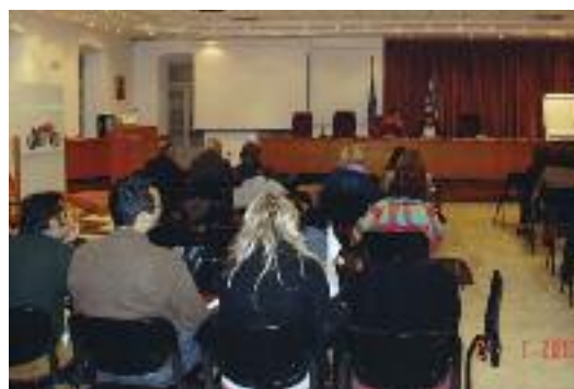
Προεδρείο & άποψη αίθουσας

Ως δεύτερο βήμα, η Δ.Ε. ΤΕΕ/ΤΑΚ σύστησε Ομάδα Εργασίας με θέμα «ΔΙΑΜΟΡΦΩΣΗ ΠΡΟΤΑΣΕΩΝ ΤΕΕ/ΤΑΚ ΓΙΑ ΤΟΝ ΠΟΛΕΟΔΟΜΙΚΟ ΣΧΕΔΙΑΣΜΟ» η οποία θα συντάξει κείμενο προτάσεων - εισήγηση προς τη Δ.Ε. αφού λάβει υπόψη της τόσο το κείμενο του ΤΕΕ - Τμήμα Κεντρικής Μακεδονίας