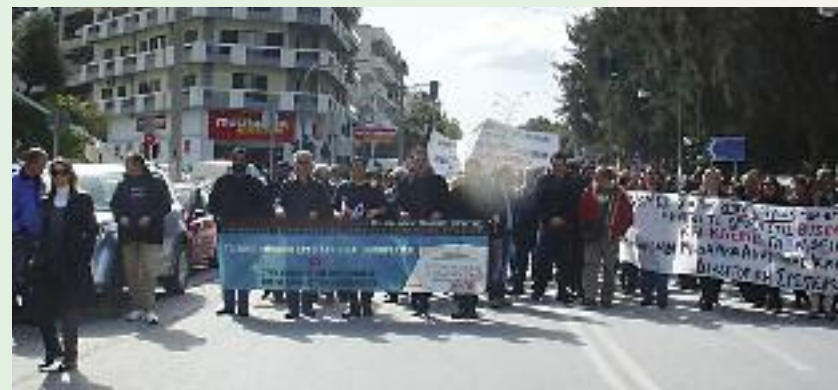
Από τη συμμετοχή στην πανεργατική απεργία της 23/2/11