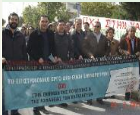
Από τη συμμετοχή στην πανεργατική απεργία της 23/2/11