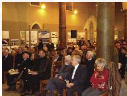
Αποψη της αίθουσας

Το τμήμα της ανατολικής Κρήτης του ΤΕΕ, επιχειρεί τα τελευταία χρό-