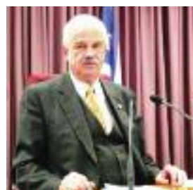
Από το Ριχάρδο Α. Ποβάσκι Πολιτικό Μηχανικό, Ε.Δ.Ε.