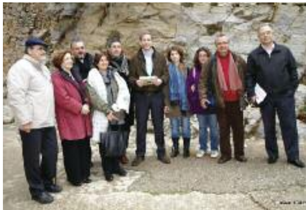
Από την επίσκεψη στη Σπιναλόγκα: στο μέσο της φωτογραφίας φαίνεται ο Υπουργός κ. Γερούλανος, περιτοιχισμένος από τους Πρόεδρο και Αντιπρόεδρο της Δ.Ε. ΤΕΕ/ΤΑΚ και τα μέλη της Ο.Ε.

Ο Πρόεδρος του ΤΕΕ/ΤΑΚ και τα μέλη της ομάδας