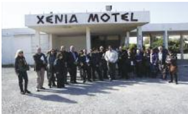
Επίσκεψη του ΤΕΕ-ΤΑΚ στο ΞΕΝΙΑ στον Καρτερό (30.01.2010)

Ηράκλειο. Την προσπάθεια του συντονισμού των ενεργειών για τη διάσωση και αυτού του κτιρίου, έχει αναλάβει πρόσφατα το ΤΕΕ/ΤΑΚ με ευρεία συμμετοχή εκπροσώπων από φορείς, υπηρεσίες και ενεργούς πολίτες της πόλης και της περιοχής και συγκεκριμένα το Σύλλογο Εκτάκτων Αρχαιολόγων - Παράρτημα Κρήτης, το Σύλλογο Αρχιτεκτόνων Ν. Ηρακλείου, την Υπηρεσία Νεώτερων Μνημείων & Τεχνικών Έργων Κρήτης, την 13η Εφορία Βυζαντινών Αρχαιοτήτων, τη Δ/ση Πολυεποχικών Λειτουργιών του Δήμου Ηρακλείου, το Γραφείο Παλιάς Πόλης Δήμου Ηρακλείου κ.α. Η διάσωση και η ανάδειξη του εμβληματικού, για την πολεοδομική και ιστορική διαδρομή της πόλης, αυτού χώρου προϋποθέτει την άμεση κήρυξή του από την πολιτεία ως διατηρητέου μνημείου και την ένταξή του σε καθεστώς προστασίας όπως προβλέπει η εθνική μας νομοθεσία.-