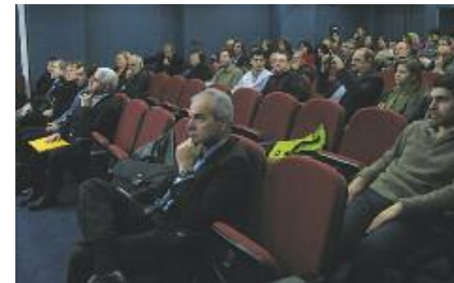
Άποψη της αίθουσας

Με τα Γ.Π.Σ. - Σ.Χ.Ο.Ο.Α.Π. καθορίζονται Περιοχές Ειδικής Προστασίας (ΠΕΠ) που δεν προορίζονται να πολεοδομηθούν. Οι Π.Ε.Π. είναι περιοχές