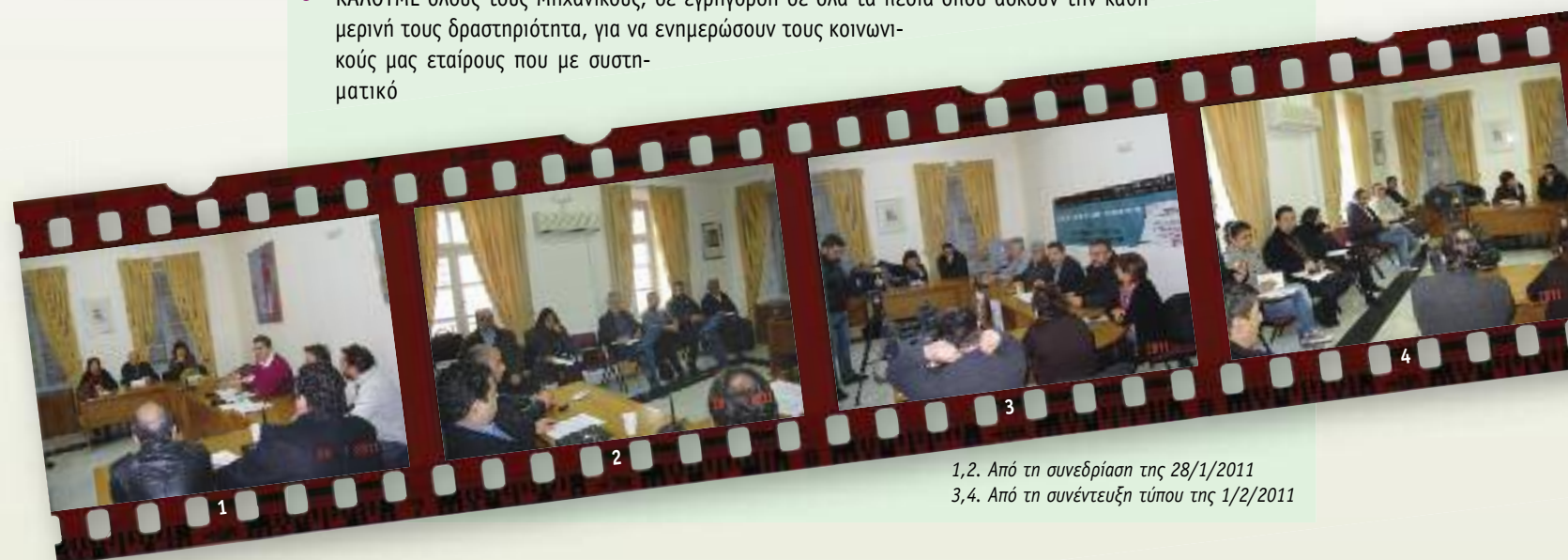
1,2. Από τη συνεδρίαση της 28/1/2011 3,4. Από τη συνέντευξη τύπου της 1/2/2011