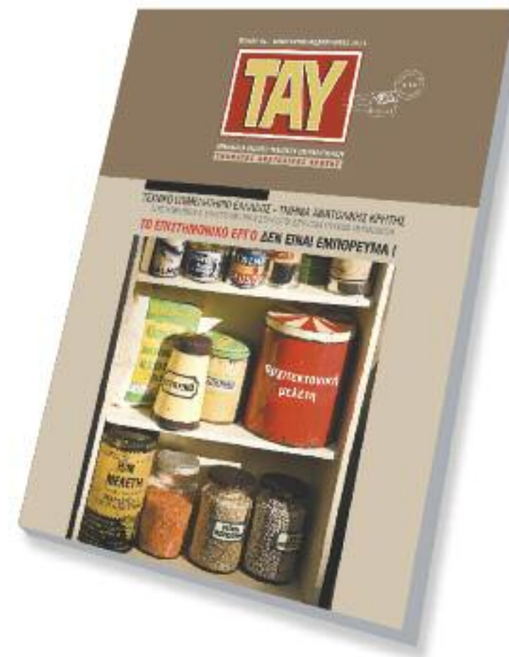
Φωτογραφία εξωφύλλου: Βλέπε σχετικό αφιέρωμα.