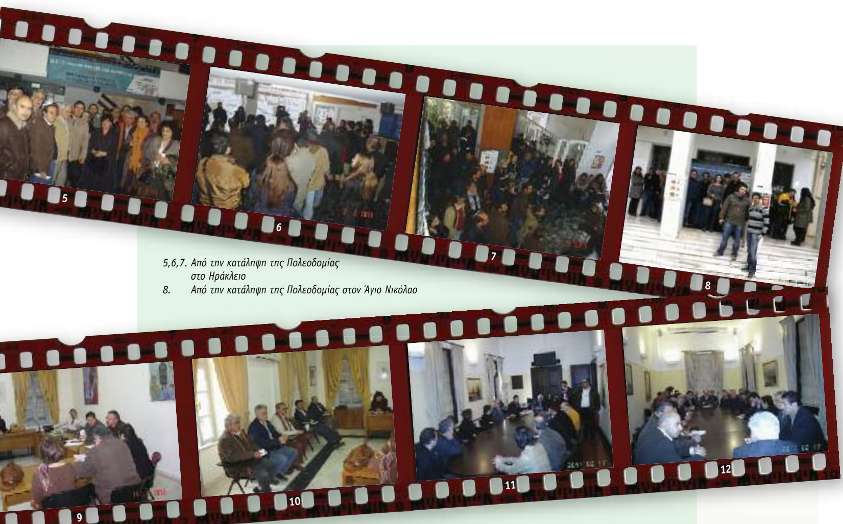
5,6,7. Από την κατάληψη της Πολεοδομίας στο Ηράκλειο