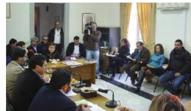
Από τη συνάντηση με τους Βουλευτές.

οι επιπτώσεις από την κατάργηση των ελάχιστων αμοιβών θα βαρύνουν το δημόσιο συμφέρον, την ασφάλεια του πολίτη, τα έσοδα του κράτους, την ανταγωνιστικότητα της οικονομίας, την ποιότητα των κατασκευών.