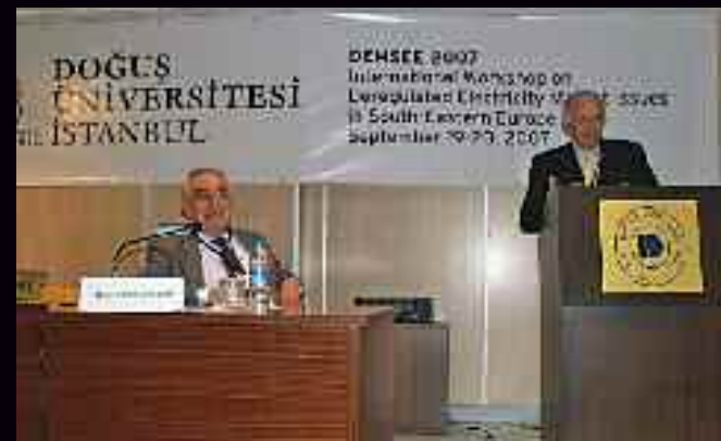
Ο Γ.Γ. CIGRE στο Βήμα στην Πόλη