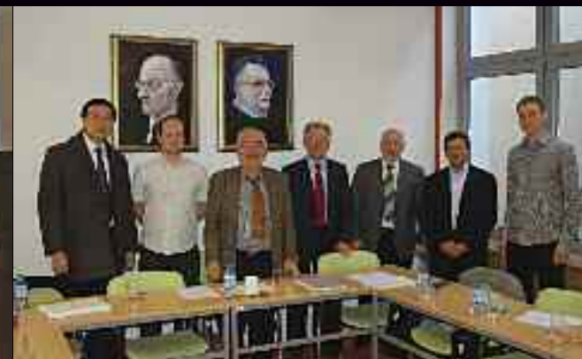
Η πιο πρόσφατη Σύνοδος της WG C2.13 στη Σλοβενία