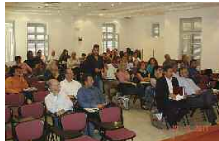
Άποψη της αίθουσας

που καλείται να αντιμετωπίσει σήμερα ο Μηχανικός κατά την εκπόνηση στατικών – αντισεισμικών μελετών και κατά το σχεδιασμό των κατασκευών με υλικά όπως είναι το σκυρόδεμα, είναι ιδιαίτερα αυξημένες. Με δεδομένη την αυξημένη σεισμική επικινδυνότητα της περιοχής μας, χρειάζεται ιδιαίτερη προσοχή κατά το σχεδιασμό, υπολογισμό και κατασκευή των έργων Πολιτικού Μηχανικού.