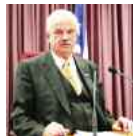
Από το Ριχάρδο Α. Ποβάσκι Πολιτικό Μηχανικό, Ε.Δ.Ε.

Στα περιθώρια των Συνόδων υπήρχε πάντα η ευκαιρία της προσωπικής γνωριμίας με τους συνεργάτες και η δημιουργία πολύχρονων πολυτιμότεων συνεργασιών, στα πλαίσια διεθνών προγραμμάτων, όπως ευρωπαϊκών, κλπ. Κάποιοι από τους συνεργάτες μας είχαν επισκεφθεί το ΑΤΕΙ Κρήτης και είχαν δώσει διαλέξεις στα πλαίσια Σεμιναριακών Σειρών, όπως η σειρά ΣΕΣΗ (Σεμινάριο Σύγχρονων Ηλεκτροτεχνολογιών) του τμήματος ηλεκτρολογίας (την οποία είχα λειτουργήσει στη δεκαετία '90), κλπ.