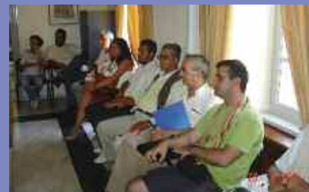
Μερικοί από τους συναδέλφους που παρακολούθησαν τη συνεδρίαση της Δ.Ε. και την ομιλία του καθηγητή.