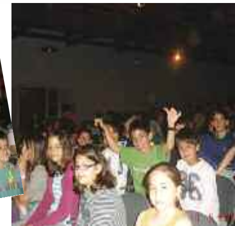
Άποψη της αίθουσας του θεατρικού Σταθμού