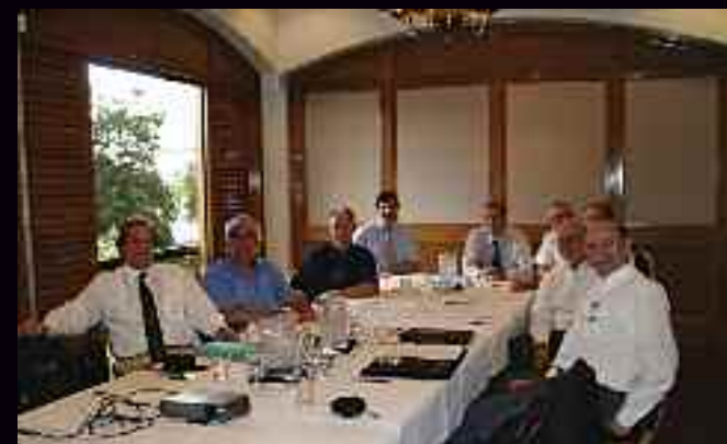
Συνάντηση της Ομάδας Εργασίας WG 39.03 στο Σαν Αντόνιο του Τέξας στις Η.Π.Α.