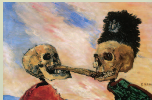
James Ensor, 1891

Το τελευταίο διάστημα γίναμε μάρτυρες της συμφωνίας για το περίφημο κούρεμα των ομολόγων. Πως όμως αυτό το γεγονός μας επηρεάζει όλους μας, ως μηχανικούς, αφού είναι μια κίνηση ουσιαστικά μεταξύ κρατών και τραπεζών; Η απόφαση για περικοπή της ονομαστικής αξίας των ομολόγων κατά 50% σήμανε, εν μια νυκτί, το «τέλος» του Ενιαίου Ταμείου Ανεξάρτητων Αυτοασχολούμενων. Το ταμείο διαθέτει ομόλογα ύψους 5,5 δισ. ευρώ, ενώ έχει στο χαρτοφυλάκιό του μετοχές, κυρίως της Attica Bank, ύψους 512,87 εκατ. ευρώ.