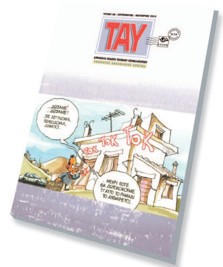
Φωτογραφία εξωφύλλου: Γελοιογραφία του Μητρόπουλου (αναδημοσίευση από τον παγκόσμιο ιστό...)