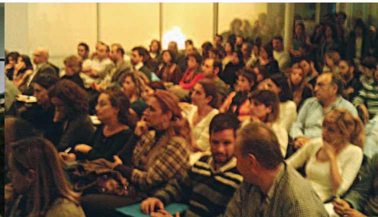
Από την εκδήλωση στο Ηράκλειο: Αποψη της αίθουσας

Η παραπάνω 4μελής Επιτροπή Εισήγησης 2 προς τη Δ.Ε. ΤΕΕ/ΤΑΚ, συνέταξε τεκμηριωμένη πρόταση για τη διαδικασία σύνταξης των φακέλων για τη νομιμοποίηση αυθαιρέτων και τον υπολογισμό των αμοιβών των Μηχανικών, την οποία η Δ.Ε., ενέκρινε μετά από σχετική συζήτηση σε συνεδρίαση της. Δεδομένων βεβαίως των συνεχών εξελίξεων στο θέμα με αντίστοιχες ανακοινώσεις και αποφάσεις του ΤΕΕ σε κεντρικό επίπεδο, που με καθυστέρηση μεν αλλά με σαφή τρόπο (που ελάχιστα διέφερε από την πρόταση της Επιτροπής του ΤΕΕ/ΤΑΚ) καθόρισε τελικά σε πανελλαδικό επίπεδο τόσο τις αμοιβές Μηχανικού για τη συγκεκριμένη διαδικασία, όσο -και κυρίως- εγκατέστησε πλήρως αυτοματοποιημένο ηλεκτρονικό σύστημα υποβολής των δηλώσεων αυθαιρέτων σε συνεργασία με το Υπουργείο, αντίστοιχο με αυτό του συστήματος υπολογισμού των αμοιβών των Μηχανικών, το ΤΕΕ/ΤΑΚ δεν θα μπορούσε βεβαίως παρά να ακολουθήσει τη γραμμή του ΤΕΕ, ιδιαίτερα στο θέμα των αμοιβών. Όμως, διαπιστώνοντας ό-