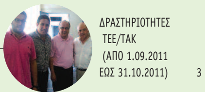
ΔΡΑΣΤΗΡΙΟΤΗΤΕΣ ΤΕΕ/ΤΑΚ (ΑΠΟ 1.09.2011 ΕΩΣ 31.10.2011)