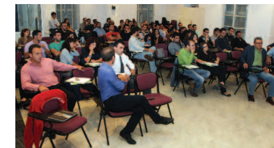
Άποψη της αίθουσας