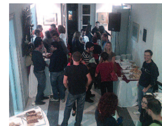
Αργά το βράδυ...